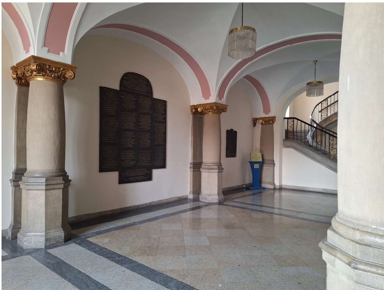
Fot. 1 Widok na hol główny. Tablica pamięci pracowników Uniwersytetu Poznańskiego oraz tablica pamięci kryptologów – Mariana Rejewskiego, Jerzego Różyckiego, Henryka Żygalskiego.

Planowane działania dotyczą jedynie wymiany lub przesunięcia istniejących tablic w celu poprawy informacji o funkcji budynku, scalenia wizualnego i stylistycznego poszczególnych tablic informacyjnych i pamiątkowych. W chwili obecnej po wejściu do budynku, po lewej stronie holu znajdują się dwie tablice. Pierwsza z nich to tablica pamięci ofiar czasu okupacji niemieckiej i sowieckiej – pracowników Uniwersytetu Poznańskiego, druga tablica pamięci Mariana Rejewskiego, Jerzego Różyckiego, Henryka Żygalskiego (fot.1).