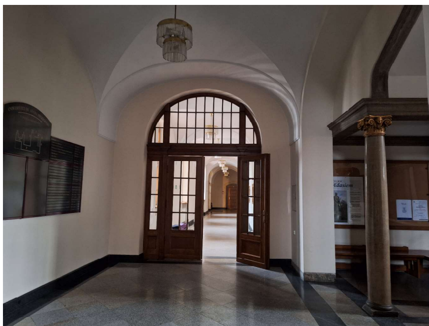
Fot. 3 Widok holu głównego.

Obok wspomnianej wnęki, naprzeciw wejścia do budynku wisi istniejąca tablica z planem obiektu (fot.4).