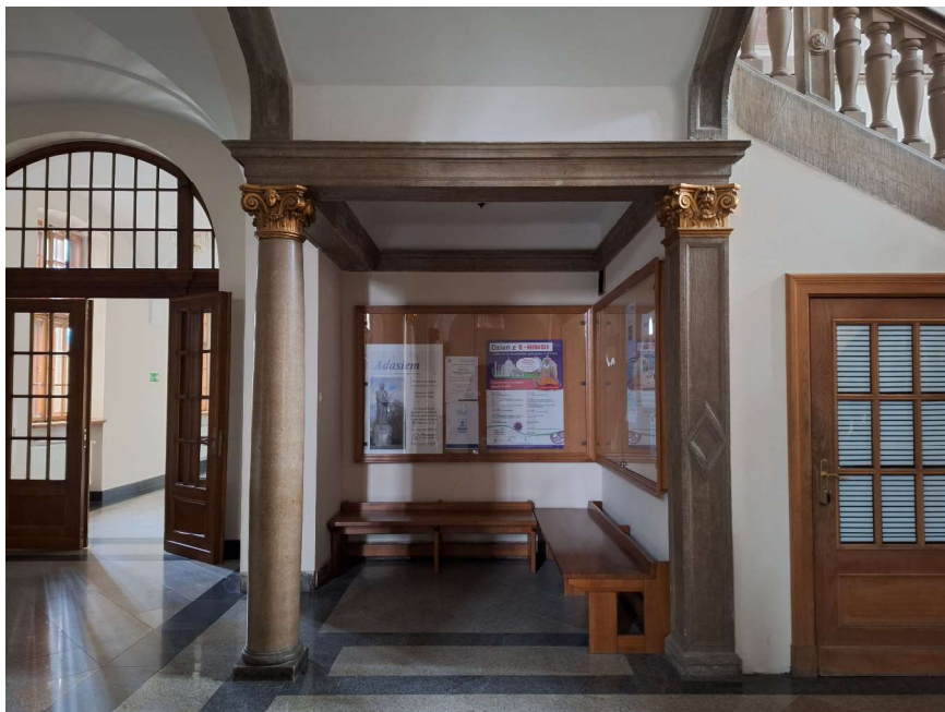
Fot. 2 Widok holu głównego na wnękę za schodami.

Po przeciwległej stronie, za schodami we wnękę znajdują się drewniane ławki oraz wiszą tablice korkowe.