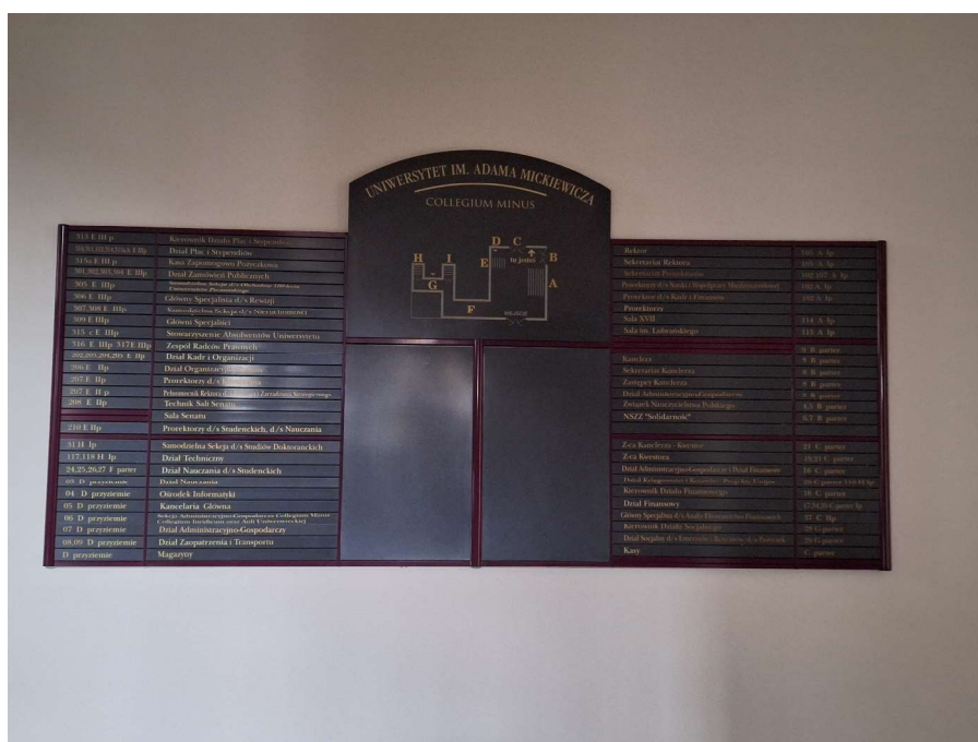
Fot. 4 Istniejąca tablica z planem obiektu.

Dalej znajdują się drugie schody w przestrzeni holu głównego.