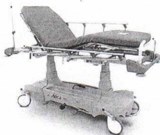
(Zdjęcie poglądowe oferowanego łóżka)

22. Czy (w pkt. 16) Zamawiający dopuści łóżko bez odejmowalnego i regulowanego zagłówka?