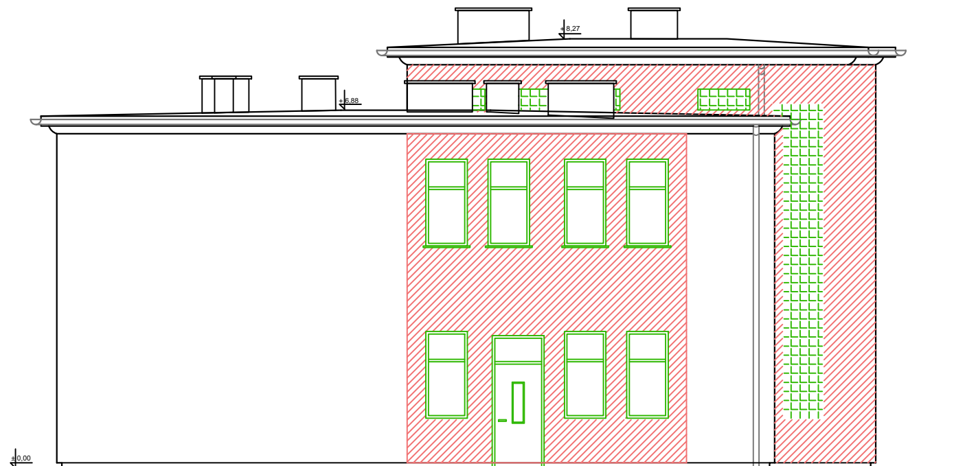
ELEWACJA PÓŁNOCNO-ZACHODNIA SKALA 1:100