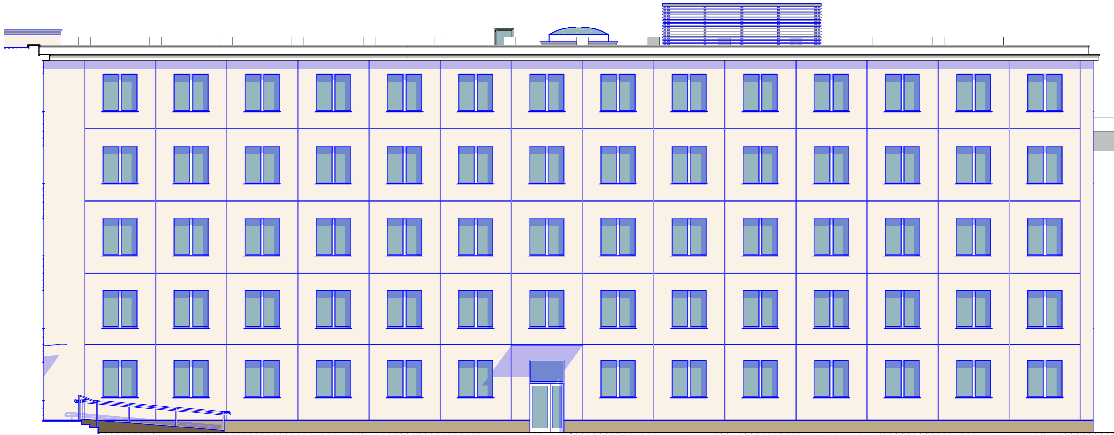
WEWNĘTRZNA ELEWACJA WSCHODNIA

WSZYSTKIE ELEWACJE W ZAKRESIE OPRACOWANIA PODLEGAJĄ TERMO-MODERNIZACJI POPRZĘZ DOCIEPLENIE WELNĄ MINERALNĄ I WYMIANĘ STOLARKI OKIENNEJ I DRZWIOWEJ. W NAWIAZANIU DO NOWYCH BUDYNKÓW, CZĘŚĆ ELEWACJI FRONTOWEJ BUDYNKU UCZELNI WYKONCZONA ZOSTANIE SYSTEMOWĄ, CERAMICZNĄ ELEWACJĄ WENTYLOWANĄ. POZOSTAŁE ELEWACJE BUDYNKU UCZELNI I AKADEMIIKA ZOSTANĄ WYKONCZONE TYNKIEM MINERALNYM IDENTYCZNYM JAK NA NOWYCH BUDYNKACH.