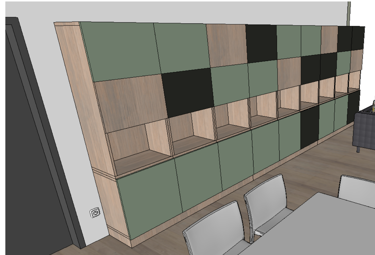
Widok - w pomieszczeniu

Wszystkie podane na rysunkach wymiary są orientacyjne. Wykonawca podczas realizacji sprawdza i dostosowuje wymiary.