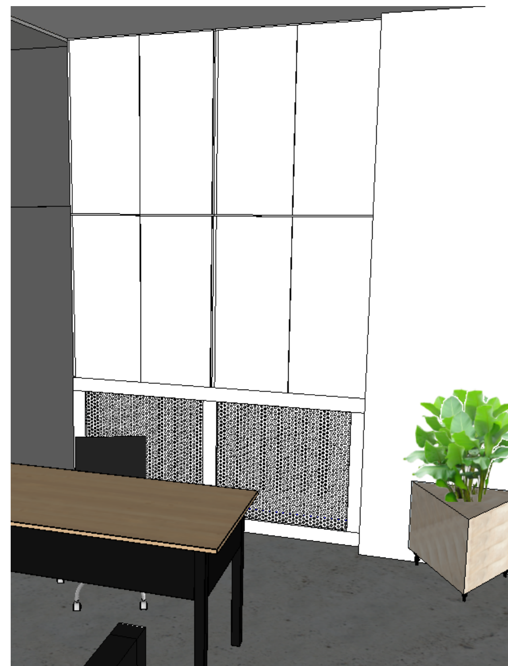
Widok we wnętrzu

Wszystkie podane na rysunkach wymiary są orientacyjne. Wykonawca podczas realizacji sprawdza i dostosowuje wymiary.