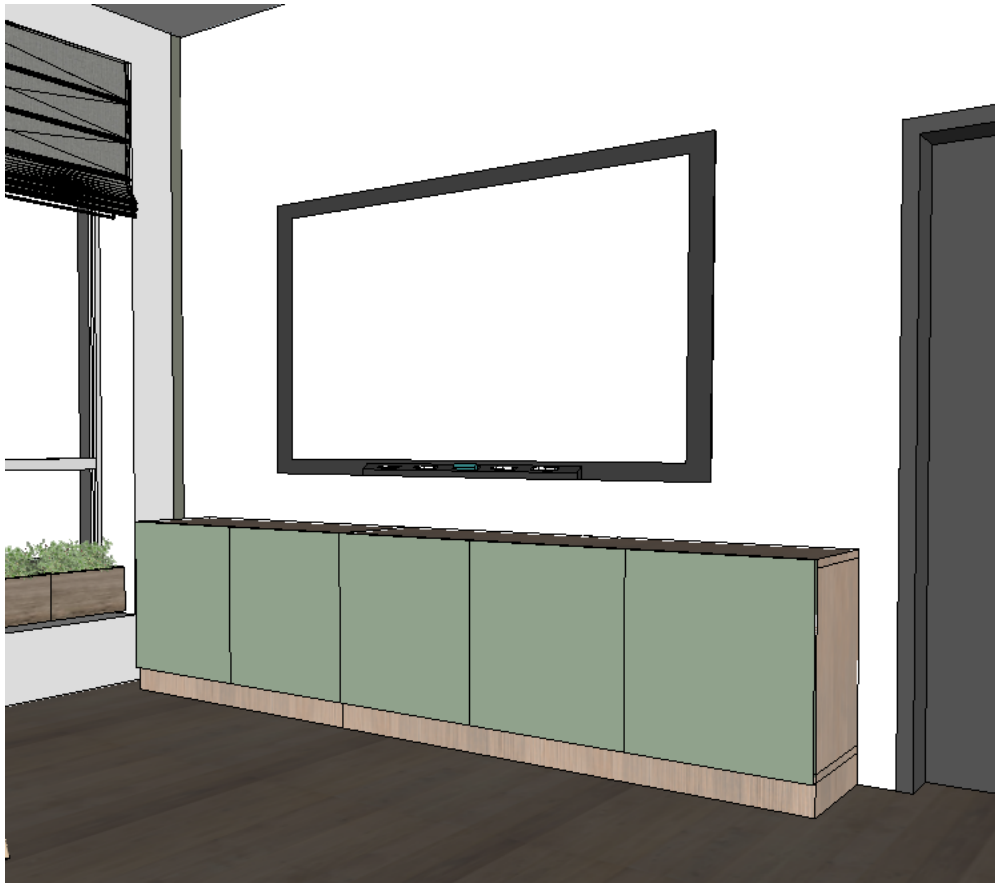
Widok - w pomieszczeniu