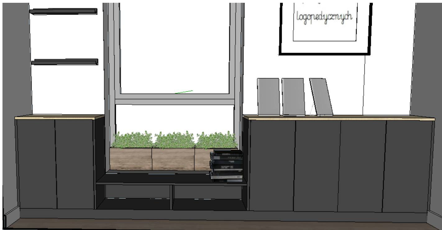
Widok w pomieszczeniu