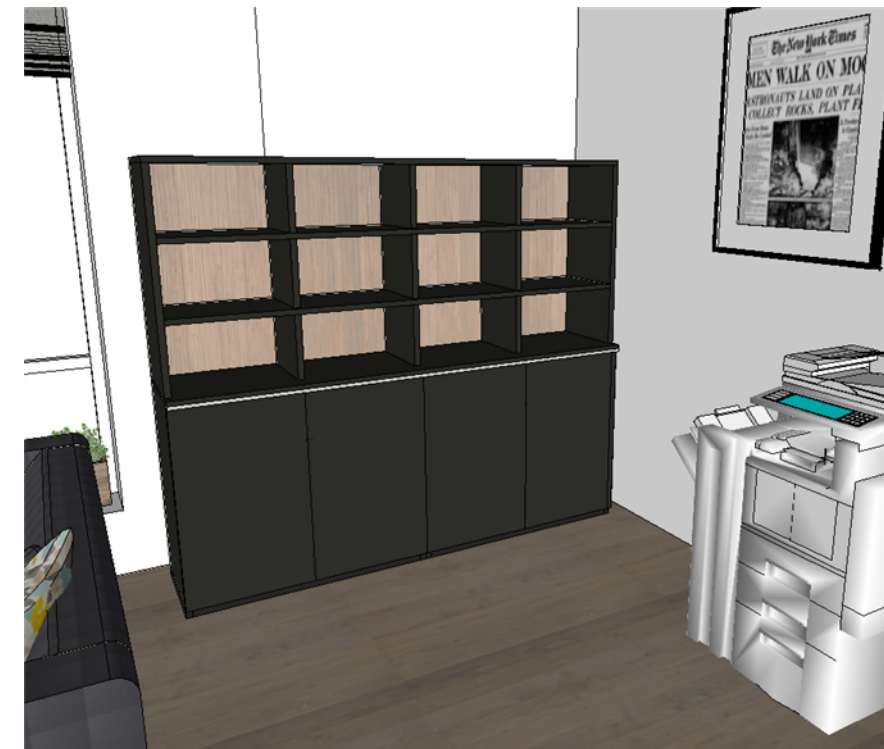
Widok - w pomieszczeniu

Wszystkie podane na rysunkach wymiary są orientacyjne. Wykonawca podczas realizacji sprawdza i dostosowuje wymiary.