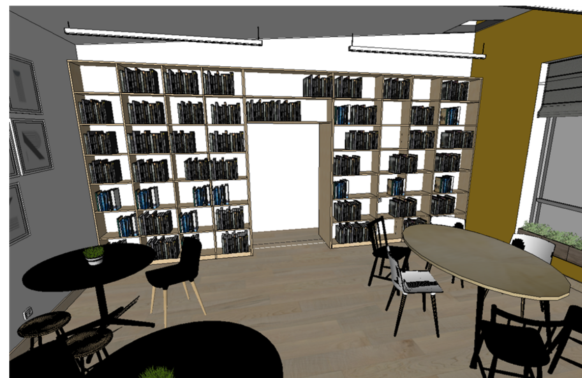
Widok w pomieszczeniu

Wszystkie podane na rysunkach wymiary są orientacyjne. Wykonawca podczas realizacji sprawdza i dostosowuje wymiary.