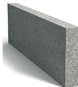
Tablica 1. Wymiary obrzeży.